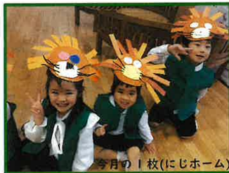
今月の1枚(にじホーム)